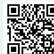
Situaciones de Aprendizaje

Para la adquisición y desarrollo de las competencias clave y específicas, el equipo docente planificará situaciones de aprendizaje , de acuerdo a los principios que, con carácter orientativo , se establecen en el Anexo III del RD 157/2022 , y en los términos que dispongan las Administraciones educativas. Puedes conocerlos en el siguiente enlace .