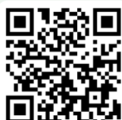
Áreas de Educación Primaria

El Anexo II del RD 157/2022 , fija las competencias específicas de cada área, los criterios de evaluación y los contenidos (saberes básicos) establecidos para cada ciclo. Puedes conocerlos en el siguiente enlace .